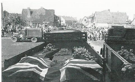
Vertrek van de begrafenisstoet te Hilversum vanaf de Geraniumschool naar de Noorderbegravingplaats.