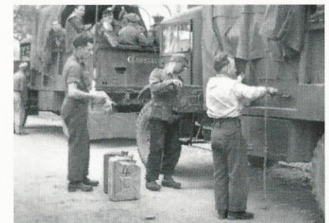
De Canadese Stormont Dundas and Glengarry Highlanders te Baarn/Soestdijk op 19 mei 1945. Op de foto is te zien dat er toen nog Duitse soldaten aanwezig waren en in dit geval ingezet werd om het tanken te verzorgen.